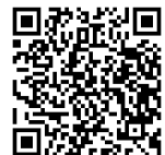
申し込み QR コード