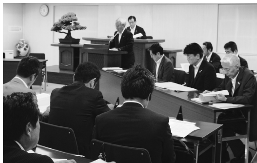
6月24日開催の第165回通常議員総会で、平成28年度議員選挙選任が承認された