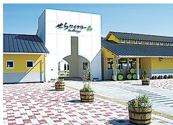
いっぱいお買い物を楽しめるよ

「せらワイナリー」(世羅郡世羅町) は、標高500mある世羅台地の気候風土にあわせ、農業振興の目的から自社農園は持たず、契約農家24戸に栽培を依頼、ワイン造りに最適な品質となるよう農家と2人3脚で品質の向上に取り組む。