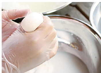
出来上がったチーズはワインと一緒に召しあがれ

「せらワイナリー」(世羅郡世羅町) は、標高500mある世羅台地の気候風土にあわせ、農業振興の目的から自社農園は持たず、契約農家24戸に栽培を依頼、ワイン造りに最適な品質となるよう農家と2人3脚で品質の向上に取り組む。