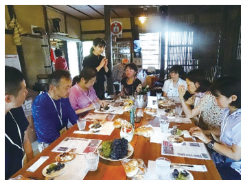
農家民宿「やまの宿西元」で昼食。古民家がイイ!

「山野峡大田ワイナリー」(山野町) は、平成22年に広島県立自然公園「山野峡」を有する自然豊かな福山市山野町でブドウ栽培を始め、平成29年から「 備後ワイン・リキュール特区 」を活用して、毎年2kg超のワインを醸造。