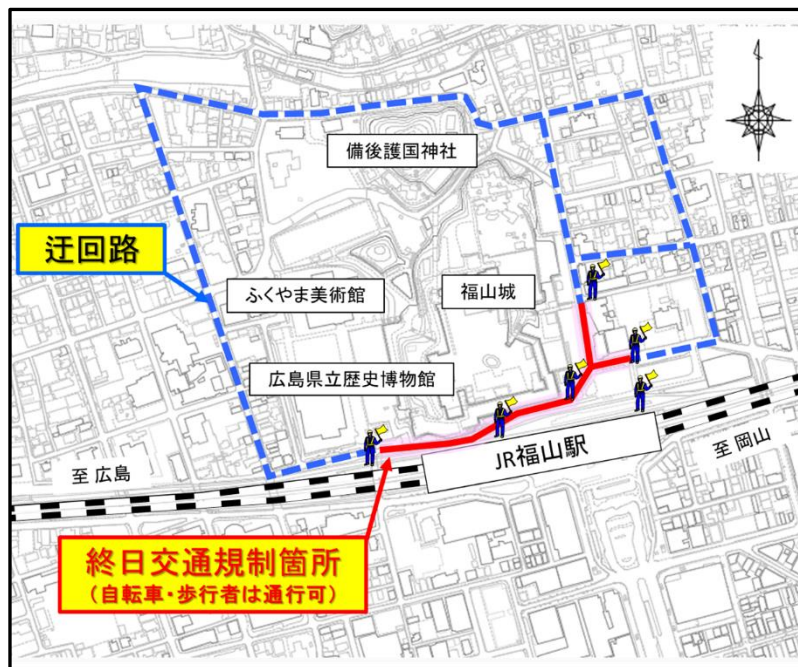
福山駅北口周辺の詳細図